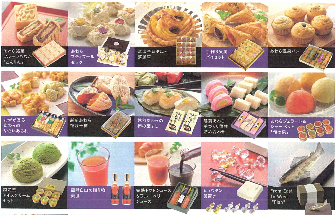
あわら銘菓 フルーツもなか 「どんりん」

あわら市商工会は、今年度、あわら産果樹・野菜などの地域資源を活用した新しい商品の開発と既存商品を全国の市場ニーズに合った商品へのブラッシュアップを支援し、県内外に販路拡大を目指す全国展開支援事業に取り組んでいます。本事業により、あわら市の新しい特産品ブランド「越前あわらブランドa」16品を認定し、ギフトカタログを作成してPRに努めています。