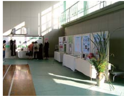
企業・観光・ 特産品紹介コーナー

また、4時から、うまいもの市等の模擬店オープン、7時から、「OTAIKO座明神」の太鼓ショー、8時から、漫才や歌謡ショーを開演し、大変な盛り上がりを見せました。