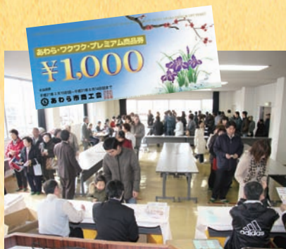
プレミアム商品券販売

昨年中は商工会の事業運営につきまして、暖かいご理解とご支援を賜り厚くお礼申し上げます。