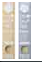
飲みみかんゼリー 15 個入り