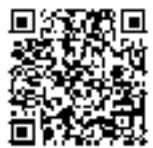
国税庁LINE公式 アカウント

確定申告会場内の混雑緩和のため、会場への入場の際には、「入場整理券」が必要となります。入場整理券は会場で当日配付するほか、国税庁のLINE公式アカウントでのオンライン事前発行も行っておりますので、ぜひご利用ください。